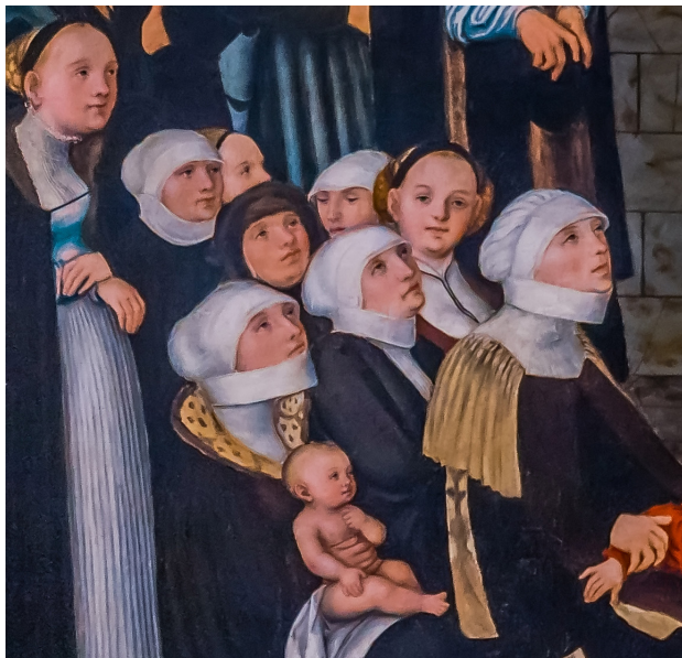
Detail des Wittenberger Altars, Lucas Cranach d.Ä., 1547